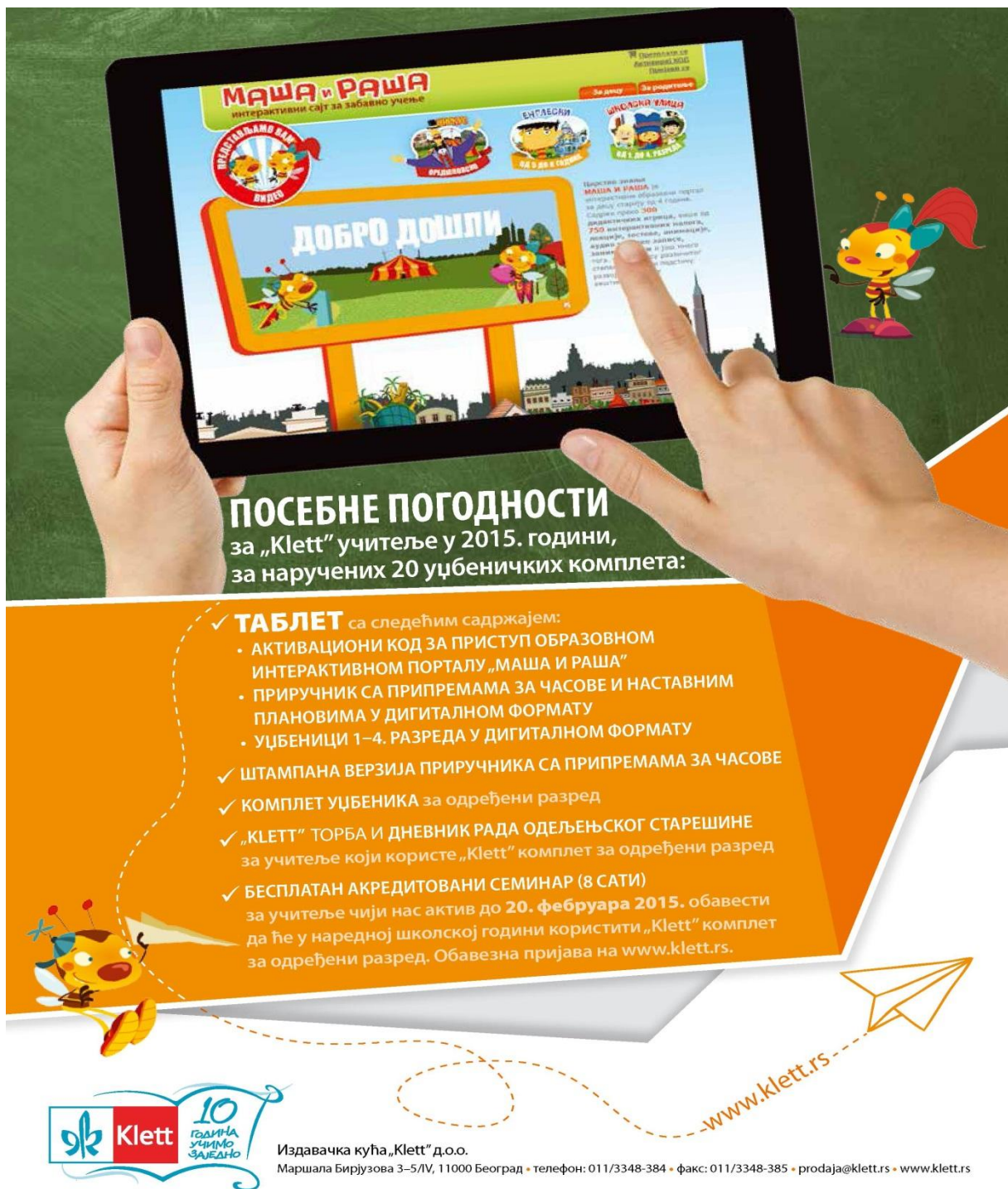
Слика 1: погодности за наставнике који изаберу уџбенике